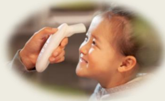
Berührungslose Stirn Tep. Messung 1 cm Distanz