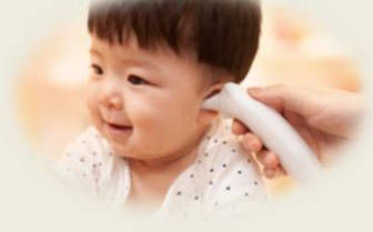
Ohr Tep. Messung Identifizierung der In-Ear-Kontur