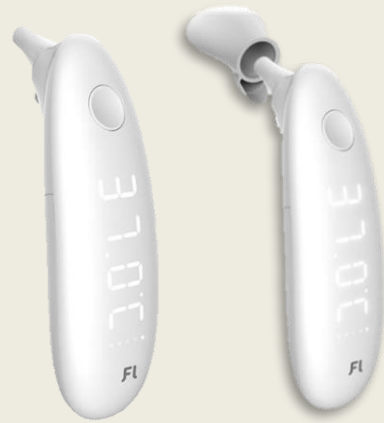
Dual: Ohr- und Stirnmessung